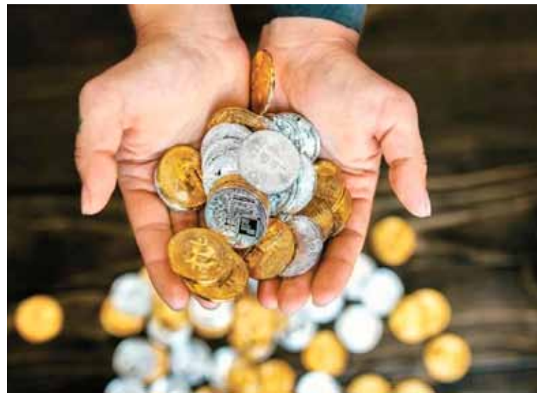
Promesas sin cumplir. La empresa no devolvió el dinero

El especialista consideró que habría cerca de 50 millones de dólares trabados en retiros, aunque la mayoría “son ganancias ficticias”.///