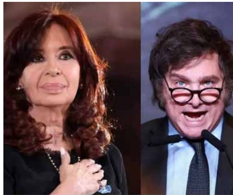
Cristina Fernández de Kirchner y Javier Milei

Por último, le reclamó: “Dejá de amenazar y aprendé a gestionar el Estado, porque ¿sabes una cosa Javier Gerardo Milei? Aunque me maten y de mí no queden ni las cenizas... tu Gobierno es un fracaso y vos como Presidente das vergüenza ajena”. (DIB)