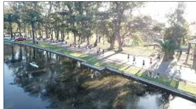
El parque, con su sombra, aportó algo de alivio a los atletas, durante una carrera con mucho calor.

- A mi novio, que esta vez se quedó en Mar del Plata, porque se aguanta que yo salga a correr todos los fines de semana.