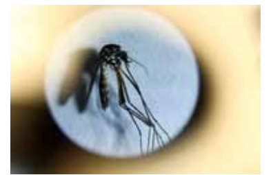
Vector. El mosquito Aedes aegypti

La vacuna se coloca en dos dosis separadas por tres meses una de otra a grupos seleccionados y en el sector privado cada aplicación cuesta unos $94.500.///