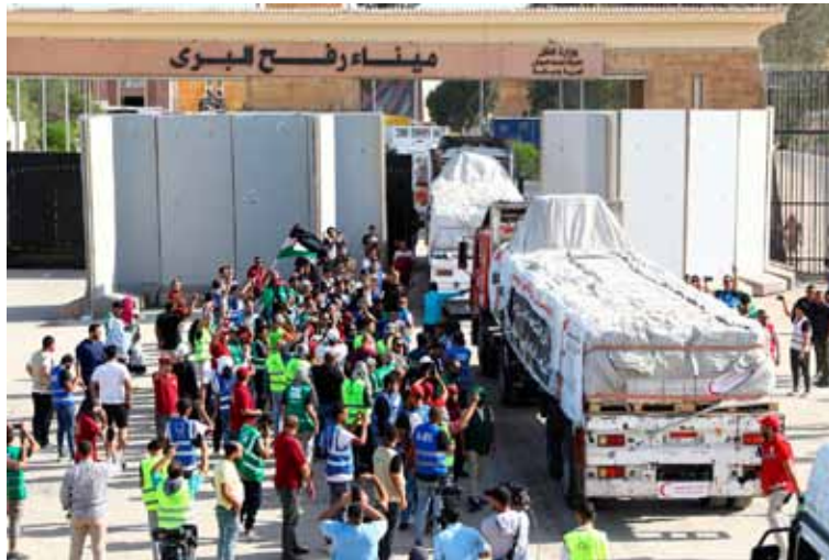
Cruda realidad. Organismo de la ONU denunció actitud de Israel

El jefe de UNRWA enfatizó la necesidad de que las agencias humanitarias, incluyendo UNRWA, tengan acceso al norte de Gaza,