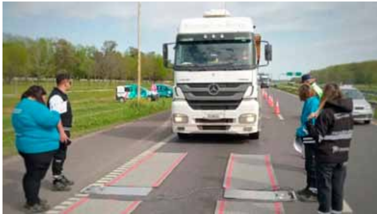
Rutas bonaerenses. Habrá más fiscalización de ARBA

“Este sistema automatizado, garantiza controles las 24 horas del día, vinculando el pesaje con