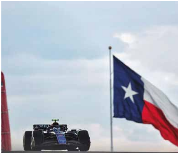
Franco Colapinto tuvo una gran actuación en Estados Unidos

Este fin de semana, Colapinto correrá su sexta carrera en la Fórmula 1, luego de las disputadas en los GP de Italia, Azerbaiyán, Singapur y Estados Unidos (en esta última también hubo Sprint