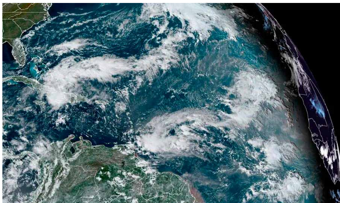
Hacia Bahamas. Al menos seis muertos por la tormenta tropical Óscar

Al menos seis personas murieron este lunes por las fuertes lluvias y las inundaciones provocadas por el paso de la tormenta tropical Oscar por el extremo nororiental de Cuba, informó la Defensa Civil de la isla.