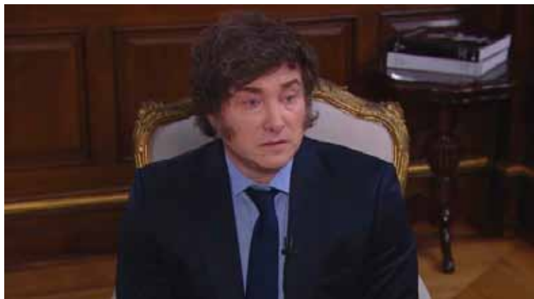
El presidente volvió a tener una polémica frase durante la entrevista en TV

Consultado sobre la liberación del dólar y la salida del cepo, sostuvo que “no va a salir a cualquier precio” y aseveró que “no hay nada que odie más que algo que restrinja la libertad de los individuos”. Luego de que el mandatario analizara pormenorizadamente el rumbo económico de su Gobierno, a su criterio positivo y con grandes aciertos como la “duplicación” del monto de las jubilaciones, Mercuriali le