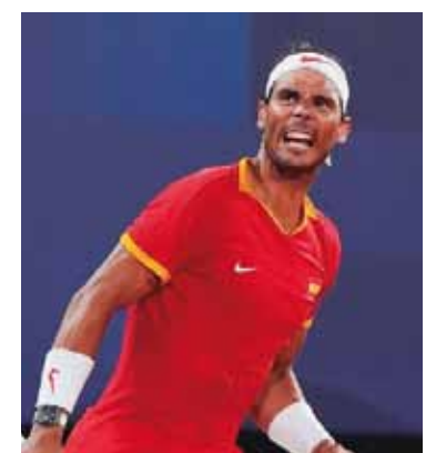
Nadal, cerca de sus últimos partidos

Uno de los principales motivos que lo llevaron a tomar la decisión fue la gran cantidad de lesiones que tuvo durante los últimos años y que lo alejaron de las canchas. "Al final es obvio que me he perdido más que todos mis rivales, en cuanto a opciones de ganar Grand Slams, pero la realidad es que me ha pasado eso. Yo no soy nunca de pensar 'si hubiera hecho' o 'si no hubiera tenido'. Ha sido así y, con ello, he tenido una carrera que jamás hubiera imaginado y estoy más que alegre", explicó.