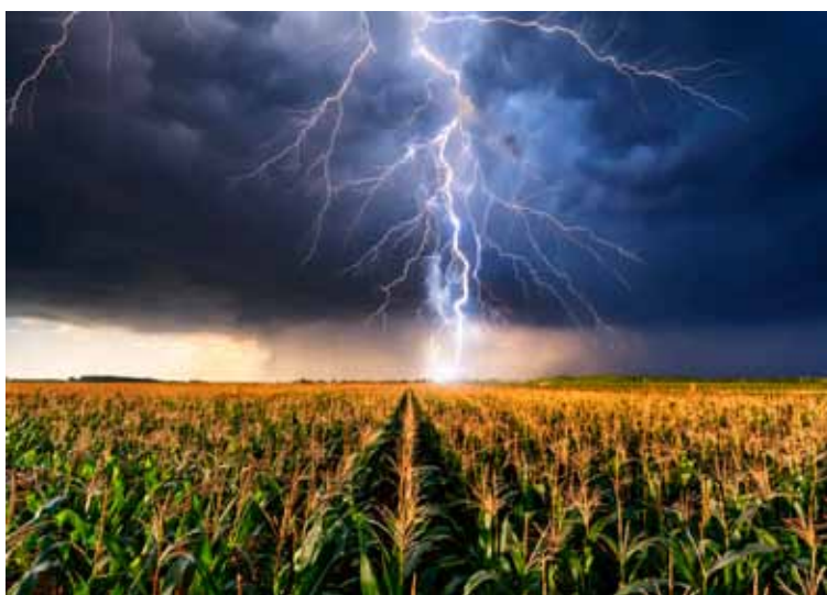
Pronósticos. Alertan sobre tormentas en 50 distritos

En tanto, el miércoles seguirán en alerta los distritos mencionados y se sumarán: Adolfo Alsina, Daireaux, Guaminí,